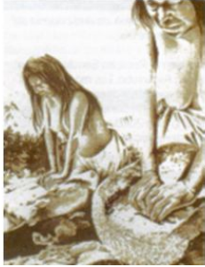
Uso de piedras de moler por parte de mujeres nativas.