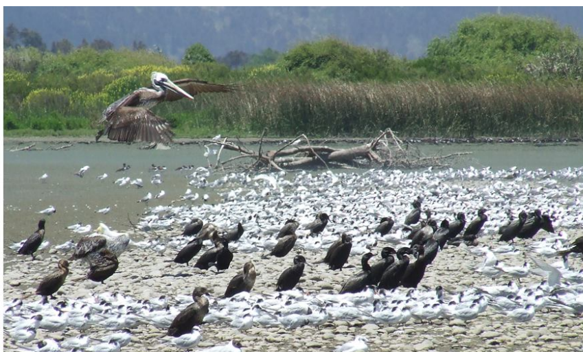
Uno de los sitios mas importantes de Chile central en cuanto a concentración de aves acuáticas