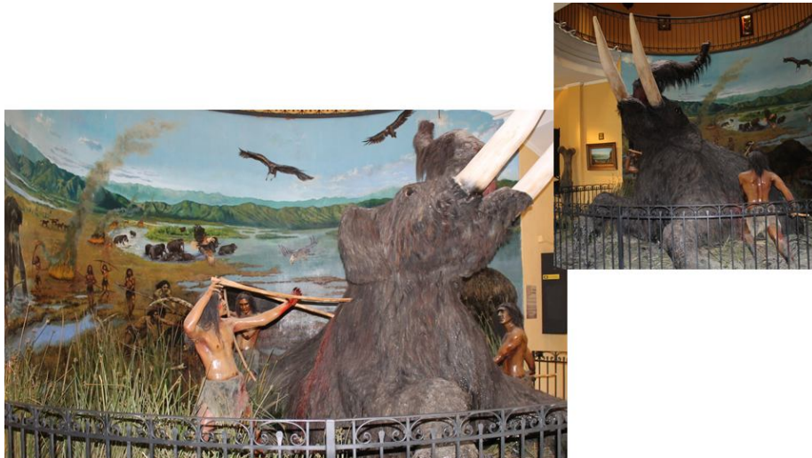
Caza de Mastodontes en la ex Laguna Taguatagua El Hombre primitivo se beneficio de los humedales