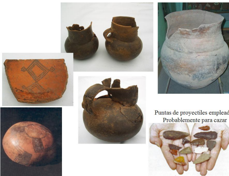
Puntas de proyectiles empleados Probablemente para cazar