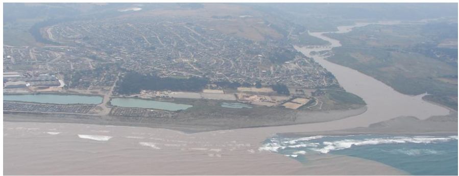
Vista aérea lagunas de Lolloe y desembocadura del río Maipo