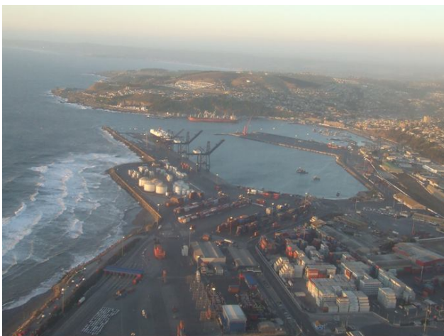
Puerto de San Antonio - Chile

ECOTURISMO Turismo de Interés Especial Observación de Avifauna Contemplación de la Naturaleza Recorridos Fotografía