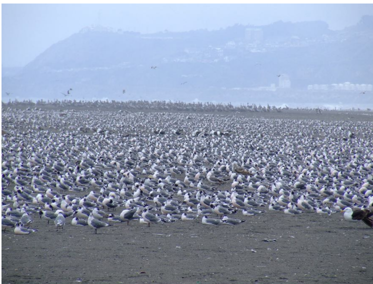
Bandada de gaviota de franklin